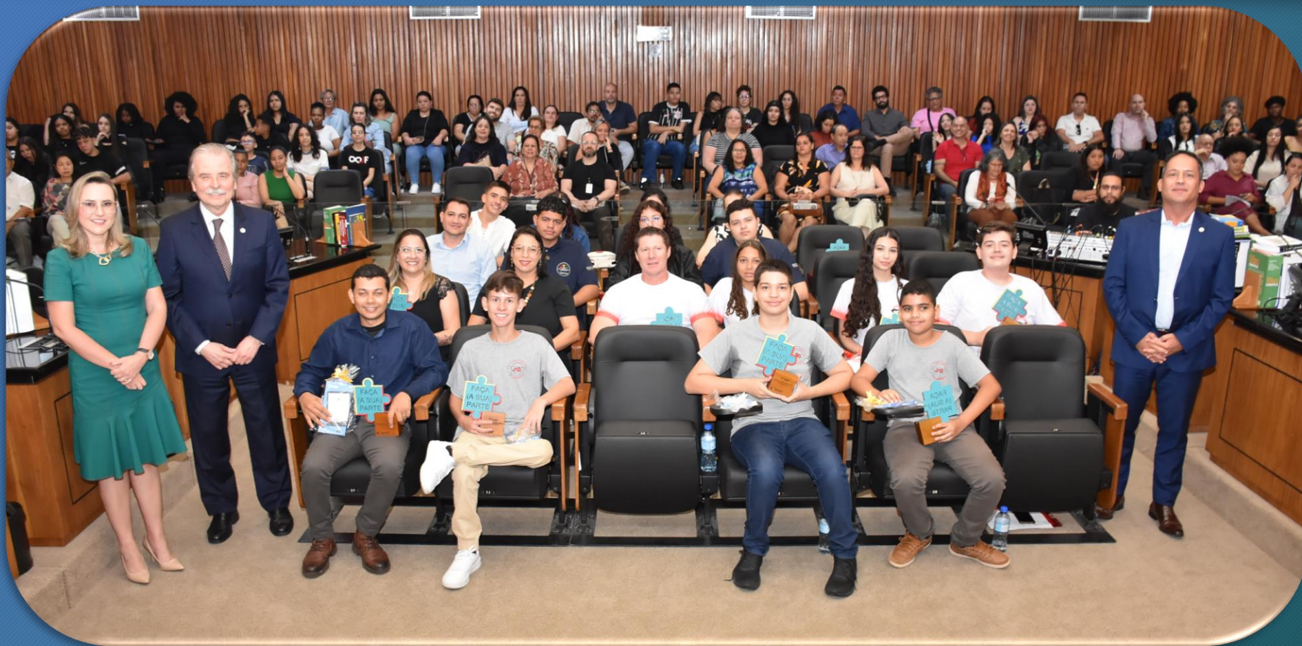
Foto Geral - da Cerimônia de Premiação: Autoridades, Estudantes, Professores Orientadores e Convidados.