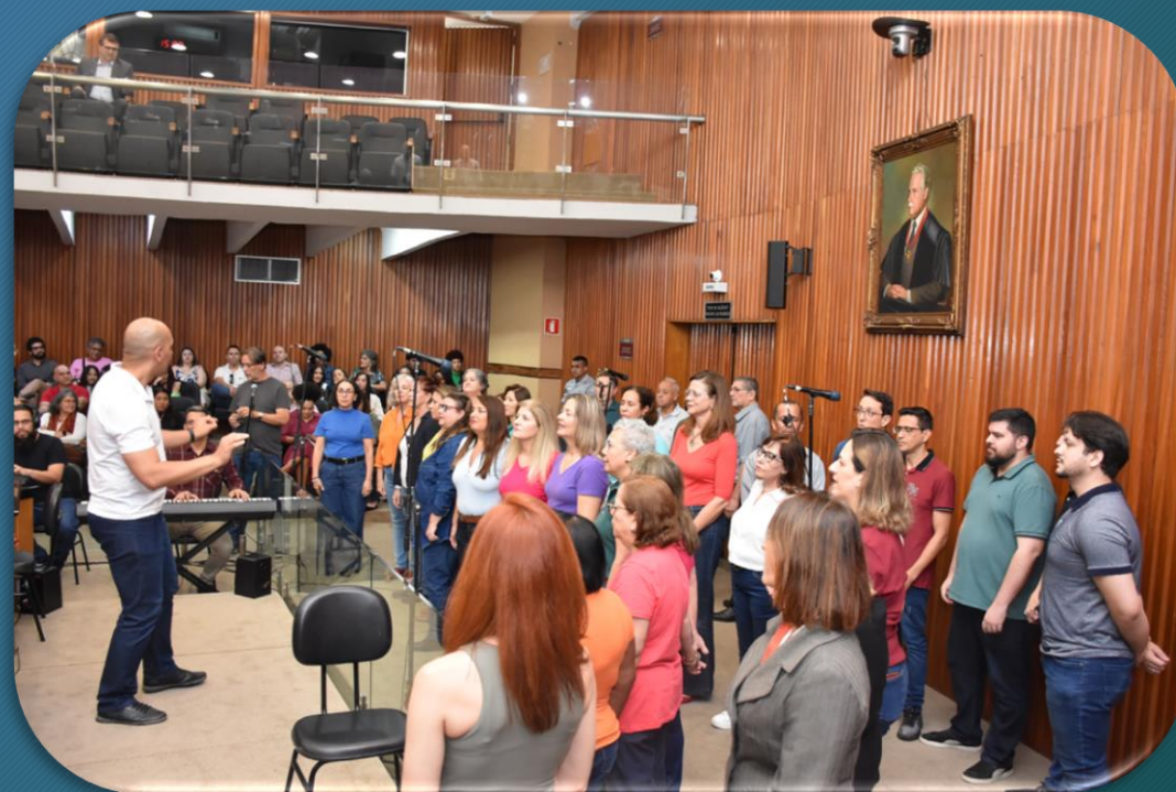
APRESENTAÇÃO DO CORAL TCE-SP